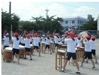
祇園祭の練習がしっかりできました

お子さんにとってとても楽しい夏休みがきました。しかし、学校生活から離れることによる気持ちのゆるみや解放感等から生活のリズムが崩れたり、交通事故・水難事故等大変心配な時期でもあります。