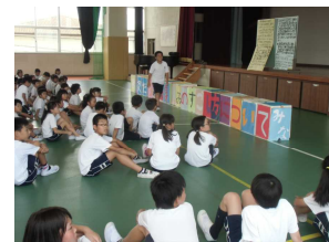
夏休みすごしかたの集会

メールを配信して連絡がとれないお家については、担任から学校の電話を通じて連絡をすることにしました。多くのお家の方は仕事中などのため返信メールができなかったようですので、たくさんの方に電話をかけないといけない状態が生まれました。電話の数が限られていますので、高学年でクラス内で確認できる場所は、クラスで確認をし、町担当が引率をし、お家の方がいない場合は、学校で待機という措置をとることにしました。学校での混乱回避と児童の安全確認の電話回線の確保のために次のことをお願いできればと考えています。